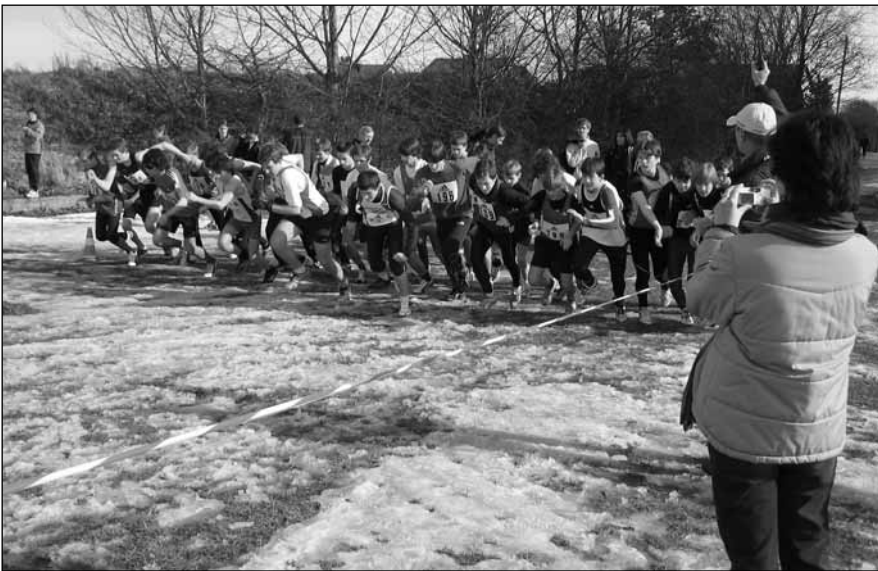
Bilder von den Crossmeisterschaften am 19.02.2006