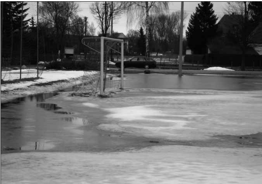
Eis und Schnee nach der Überschwemmung am Trainingsplatz