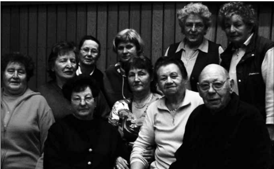
Die Senioren beim wöchentlichen Training

In dieser Gruppe sind Jungen auch herzlich willkommen.