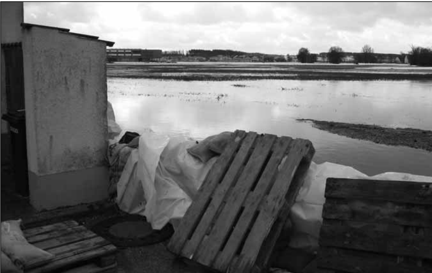
Sandsackbarrikade am Vereinsheim

Dank an alle, die bei der Rettungsaktion mitgearbeitet haben.