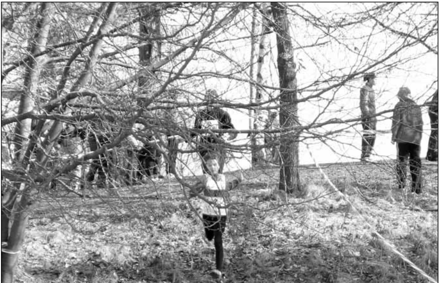
Bilder von den Crossmeisterschaften am 19.02.2006