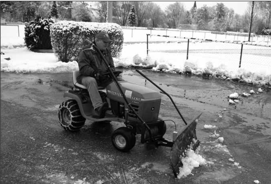
Schneeschieber gespendet von der Fa. Ehrenleitner & Bucher.

ein Geschenk der Fa. Ehrenleitner & Bucher GmbH aus Indersdorf. Mit ihm können die großen Schneemengen nur leichter als bisher bewältigt werden.