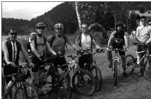
Die Taekwondoler am Spitzingsee

Nachdem alle Teilnehmer von der Tour begeistert waren, beschloss man auch zukünftig solche Touren ins Freizeitprogramm der Abteilung aufzunehmen.