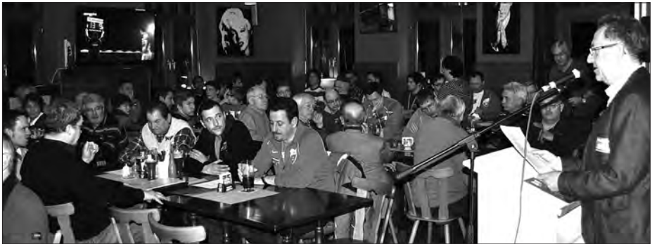
Gut besuchte Hauptversammlung.

Bericht zum Stand des Projekts Kunstrasenplatz. Die Berichte der Abteilungsleiter schlossen sich an.