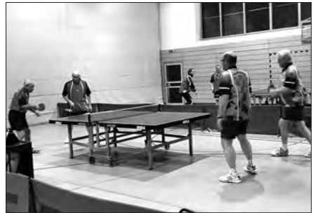
2 Stunden und 20 Minuten dauerte der Aufstiegskampf zwischen dem Post SV und dem TSV Indersdorf. Am Ende stand es 9:4 Spiele für den Post SV mit 532:459 Bällen.