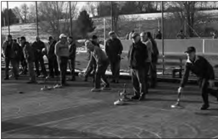
Die Stockschützen in Aktion.

tete Pleite erlebten die TSV Schützen. Woran lag es? Mit einem Ergebnis von 13:23 Punkten wurden unsere Männer eindeutig geschlagen. Hier ist Ursachenforschung angesagt.