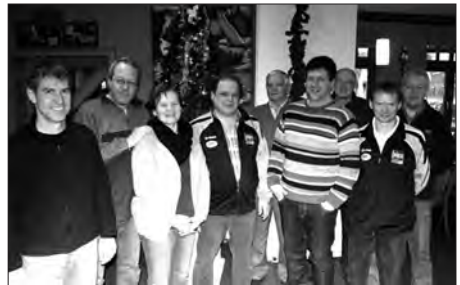
Die Sieger aus Ried.