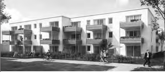
MARKT INDERSORF EIGENTUMS- WOHNUNGEN