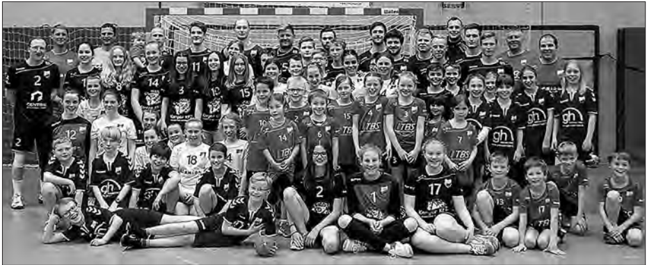
Die Handballgemeinschaft des TSV Indersdorf 2016/17 beim letzten großen Heimspieltag.

Der letzte Heimspieltag – ein großes Handballfest