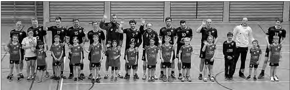
Männermannschaft beim Einlaufen mit den Miniten zum Spiel gegen MTV Pfaffenhofen am letzten großen Heimspieltag.