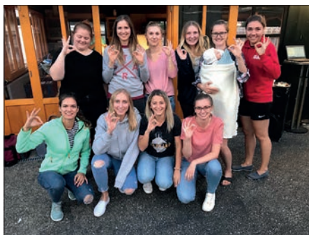
Teamausflug zu den Stockschißen.