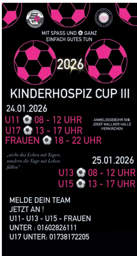
Flyer zu unserem Hallenturnier im Januar 2026.