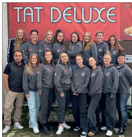
Die neuen TAT-Deluxe-Hoodies.