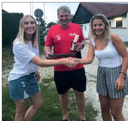
Toms Vertragsverlängerung 2020.