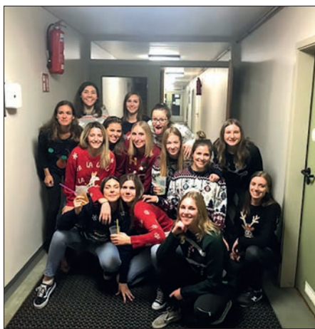
Eine von vielen Weihnachtsfeiern.