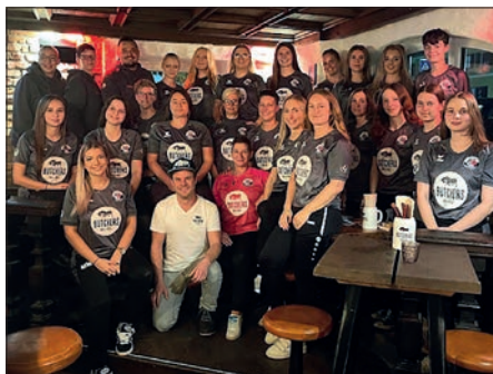
Die neuen Butchers-Trikots.