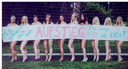
Aufstieg der Zwoaten 2014.