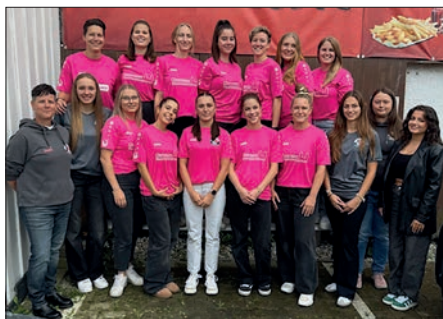
Die neuen Aufwärmtrikots vom Glonntaler Hausmeisterservice.