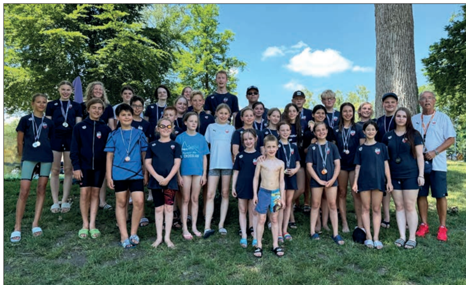
Kreisjahrgangsmeisterschaften 2025 auf der Langbahn: Jahrgänge 2016 bis 2007.

An diesem rundum gelungenen Wettkampftag konnten die kleinen Haie erste Wettkampfluft schnuppern und stolz auch einige Medaillen mit nach Hause nehmen. Die erfahrenen Schwimmer dominierten in ihren Jahrgängen und sechs von ihnen standen sogar bei jedem Start auf dem Siebertreppchen. Reihenweise purzelten zum Ende der Saison noch mal die bisher erkämpften Bestzeiten, so dass auch weitere Qualifikationszeiten für die Oberbayerischen Jahrgangsmeisterschaften in Ingolstadt und Bayerischen Jahrgangsmeisterschaften in Regensburg, die noch im Juli 2025 stattfinden, auf das Konto der Haie gingen.